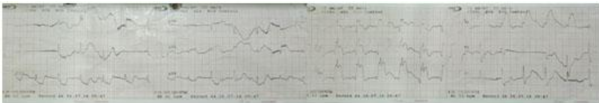
Gambar 1. EKG pre-trombolitik

Kami melaporkan kasus, seorang pria berusia 60 tahun datang ke unit gawat darurat (UGD) RSUD Panembahan Senopati, Bantul pada bulan Agustus 2016 dengan keluhan utama nyeri dada khas menjalar ke lengan kiri dan tembus ke punggung belakang, dengan intensitas semakin lama semakin meningkat sejak 4 jam sebelum masuk rumah sakit. Riwayat penyakit dahulu yaitu terdapat kebiasaan merokok, dislipidemia, dan hipertensi. Pada pemeriksaan fisik dan tanda vital masih dalam batas normal. Saat masuk, 12 lead elektrokardiogram (EKG) menunjukkan elevasi segmen ST V1-V5 dengan detak jantung (HR) 85 kali per menit.