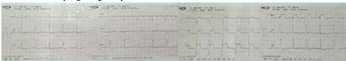
Gambar 2. EKG post-trombolitik

Pasien dirawat di unit perawatan intensif (ICU) RSUD Panembahan Senopati, Bantul dengan terapi infus NaCl 0,9% 16 tetes per menit (tpm), fondaparinux 1x2,5mg, aspilet 1x80mg, clopidogrel 1x75mg, captopril 3x12,5mg, bisoprolol 1x2,5mg, dan atorvastatin 1x40mg.